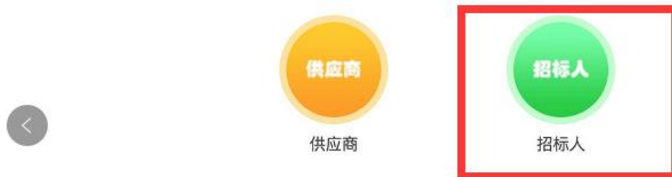
南方电网电子采购交易平台企业证书申请

证书初购、续期地址为： https://ixin.itrus.com.cn/s/csgbidding ，选择招标人入口进入，如下图：